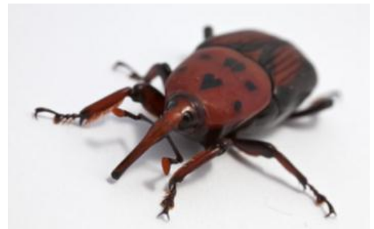
Red Palm Weevil, Palmrüssler oder Rhynchophorus ferrugineus

Seine Heimat ist der indonesische Raum. In einem intakten Ökosystem stellt er kein Problem dar. Er hat eine Vielzahl von Gegenspielern angefangen bei Insekten über Reptilien bis hin zu Säugetieren. Dieser Umstand scheint der Grund für die enorm hohe Reproduktionsrate zu sein. Die hohe Reproduktionsrate ist für das Bestehen der Art notwendig. Umso dramatischer ist die Situation, wenn der Red Palm Weevil in Regionen eingeschleppt wird, wo keine auf ihn adaptierten Gegenspieler vorhanden sind.